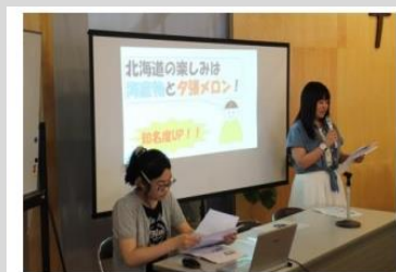
2016年 来広し夕張市について発表する中学生