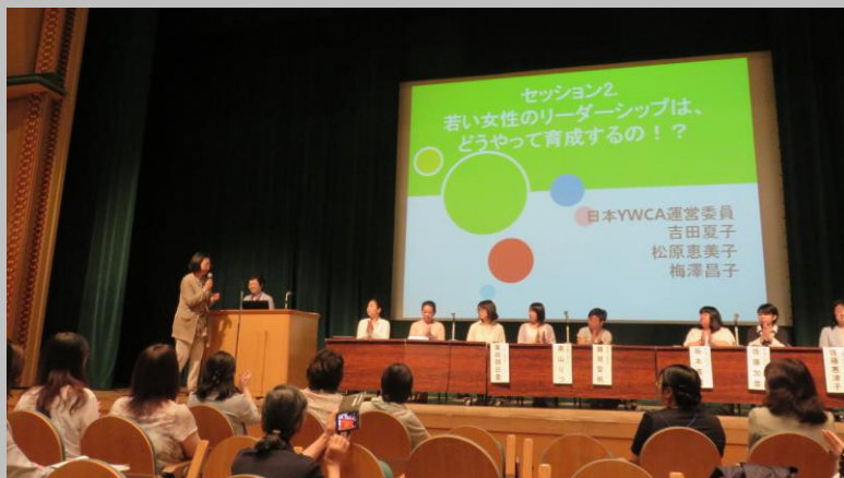
東京・大阪・熊本のユース会員による報告