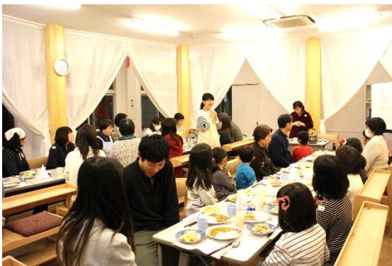
学生ボランティアによるメニュー解説

子ども食堂を運営するために、大手町に新拠点を持つことが評議員会で承認されました。