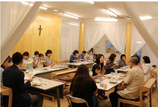
広島主城教会の会堂での食事風景

本格的な春の訪れとなりました。皆さまいかがお過ごしでしょうか。3月12日(日)に開催されました、第一回臨時評議員会において、子ども食堂については新拠点にて継続し、地域を変えて大手町で行い、年度当初より広島市家庭子ども支援課の「ひとり親家庭等居場所づくり事業 補助金」の受託を目指すことが承認されました。これを受けて、大手町にある物件を借り、新拠点として活動してまいります。 2016年度、子どもの健やかな成長を見守り、助ける活動として、子ども食堂の運営を開始しました。広島主城教会の会堂・キッチンをお借りして、2017年3月までに9回、子ども、大人の参加者、ボランティア、のべ300人以上が夕食を共にしました。新拠点での運営も、子どもたちが安心して過ごせる、居場所づくりを忘れず、子どもたちの利益優先で運営するよう心掛けていきたいと思っております。 また、会員・関係者の皆様にとっても諸活動の拠点となるよう、お知恵、お力をお借りしたいと思っております。