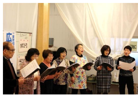
わいわいコーラスの発表の様子