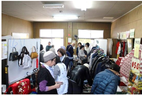
大盛況のリサイクル販売