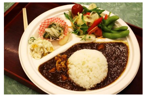
健康的な食材を使ったカレーランチ