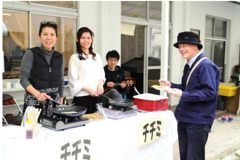
本格的なチヂミ、とても喜ばれました

天気も良く好評のうちに終了することができました。ご来場いただいた皆様、お手伝いいただいた皆様、リサイクル品の提供いただいた皆様、誠にありがとうございました。のべ300人ほどの皆さまにご来場いただきました。心より感謝申し上げます。