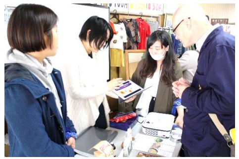
女学院大学の学生によるフェアトレードのPR